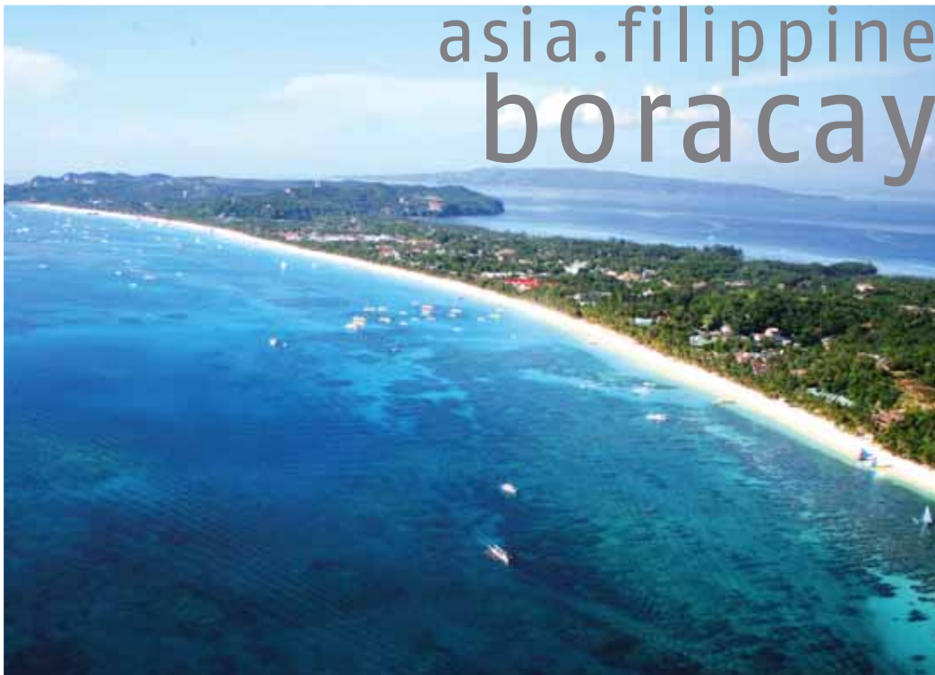
Davanti la famosa White Beach e dall'altra parte dell'Isola la Bulabog Beach (Spot windsurf + kite)