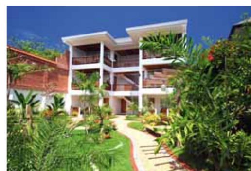
Per gli ospiti del Pinjalo: sedie a sdraio e ristorante sulla White Beach