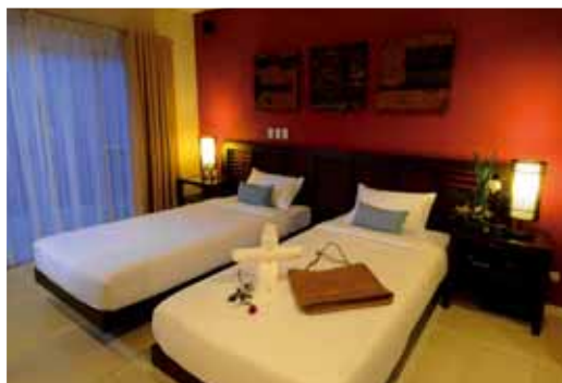
7 Stones Superior Room