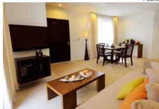
7 Stones Junior Suite