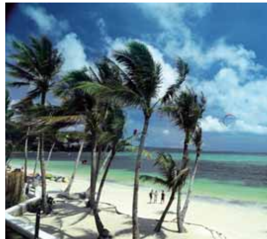
Blick vom Hotel 7 Stones