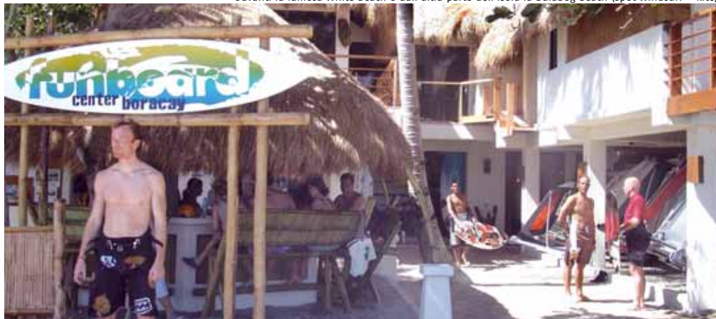
Funboard Center Boracay