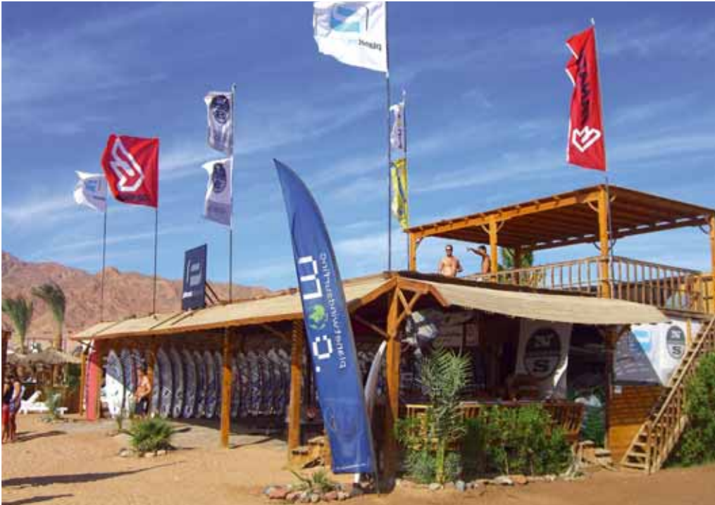
Planet Windsurfing Center