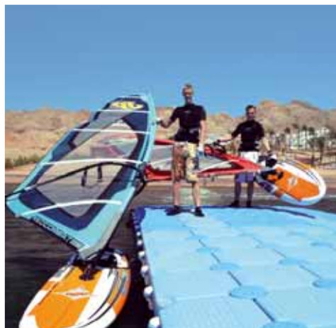
rampa di partenza