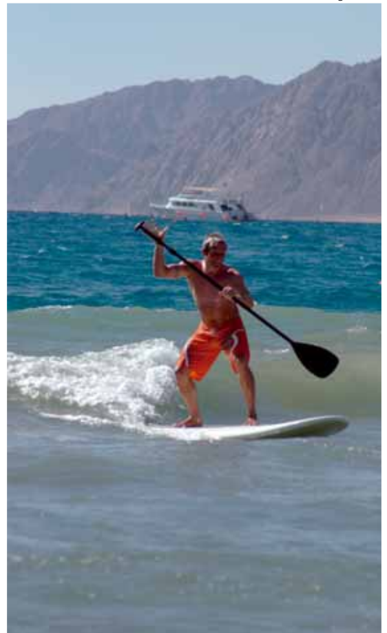
Stand up paddling boards presso il centro Planet