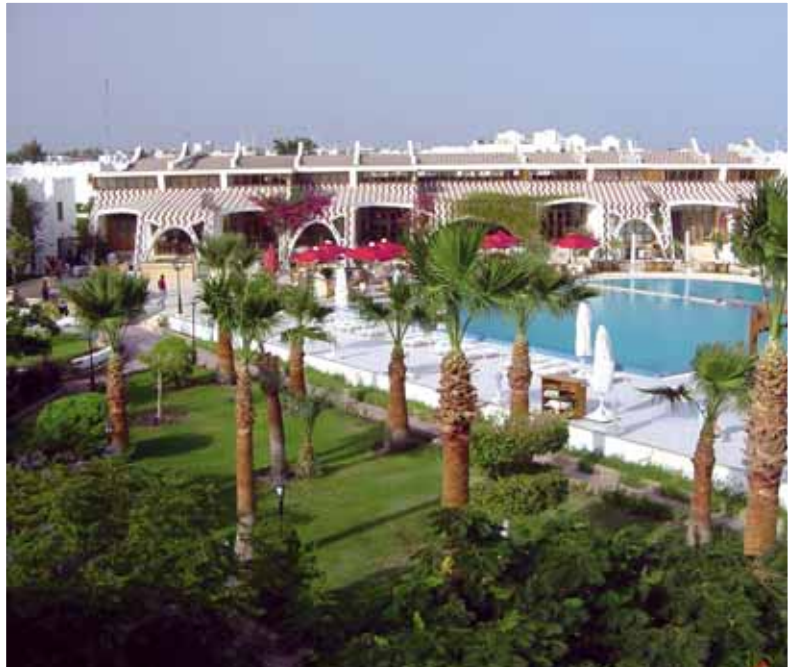
Piscina Hotel Swiss Inn

Bambini: Garfields Club per bambini dai 3 ai 8 anni, campo giochi. Disponibili lettini e sedie per bambini. A pagamento servizio babysitter.