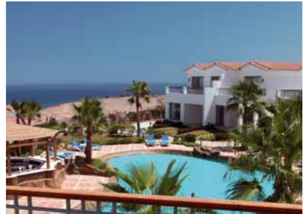
Bay View Resort & Spa