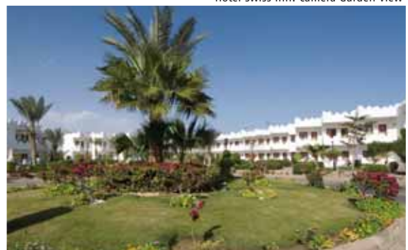
Giardino Swiss Inn