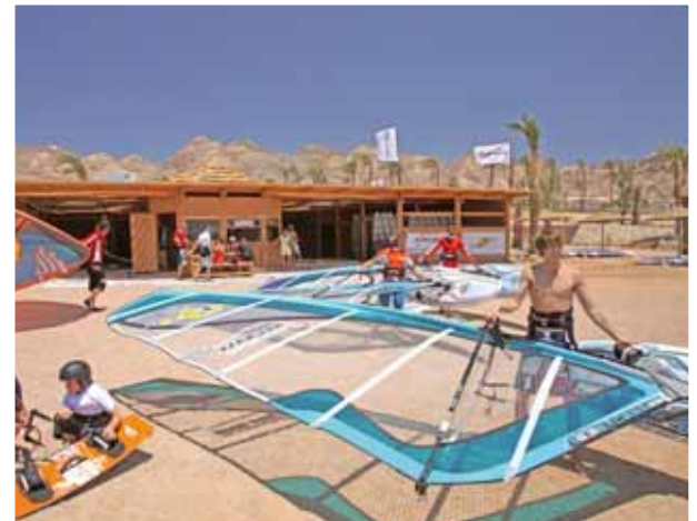
Harry Nass Center 4

Sport e divertimento: centro sub Blue Ocean Dive, campo da tennis, palestra con aria condizionata, zona Spa & Wellness.