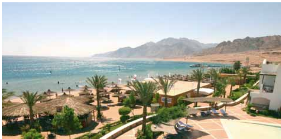
Surfcenter Harry Nass 2 presso l'Iberotel Dahabeya