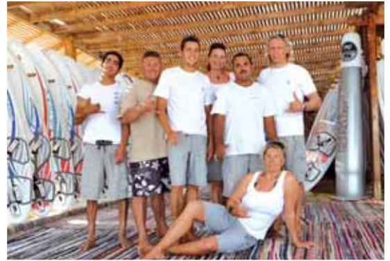
Team Planet Windsurfing Center