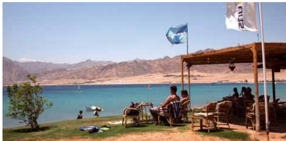
Beachbar surfcenter Harry Nass 1