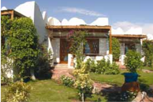
Hotel Swiss Inn: Camera Sea View