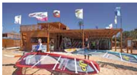
Surfcenter Harry Nass 3

Direttamente davanti all'Hotel SWISS INN si trova il nuovo Harry Nass Center 3 . Anche questo centro dispone di nuovissime attrezzature JP e Neil Pryde ed offre gli stessi servizi del centro 1, 2 e 4.