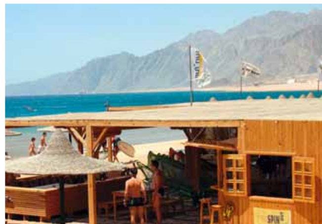
Surfcenter Harry Nass 2