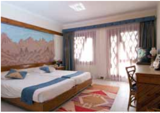
Hotel Swiss Inn: Camera Sea View