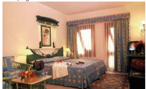
Hotel Swiss Inn: Camera Garden View

Wellness: centro benessere con massaggi, aromaterapia, sauna, bagno turco.