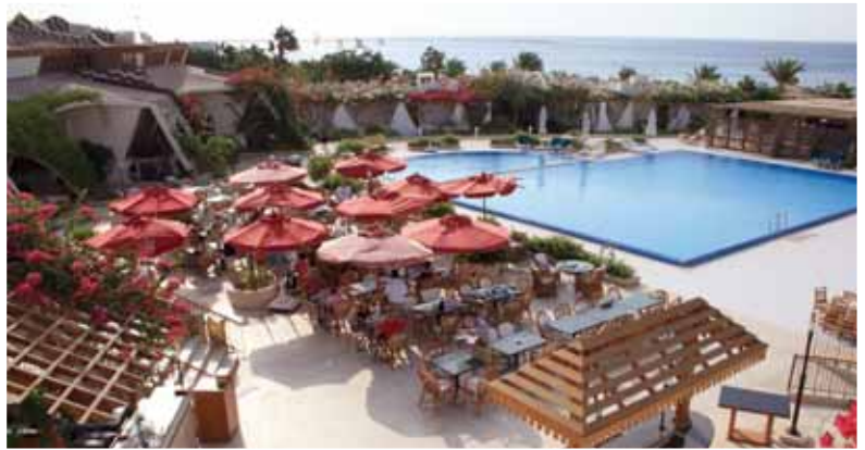
Hotel Swiss Inn: Terrazzo del ristorante

Trattamento: mezza pensione oppure All-Inclusive. Nel ristorante El Khaima si prepara il buffet per la prima colazione. Per la cena c'è, oltre al buffet, anche la possibilità di mangiare à-la-carte. A mezzogiorno si può mangiare nel ristorante Oasis vicino alla piscina. La formula All-Inclusive comprende pensione completa a buffet, una prima colazione speciale per chi si alza tardi, spuntini dalle ore 10.00 alle 11.00, caffè, té e torte dalle 15.00 alle 16.00, gelato per i bambini dalle 12.00 alle 18.00, softdrink, bibite locali alcoliche dalle ore 10.00 alle 23.00.