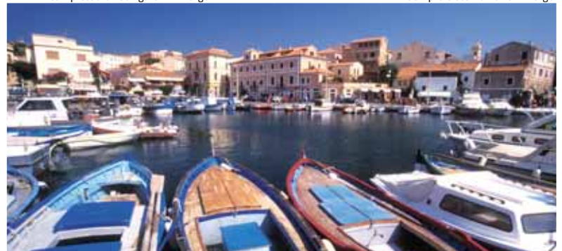
Porto La Maddalena