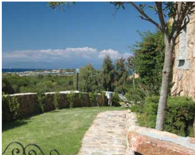
Vista da un appartamento del Borgo