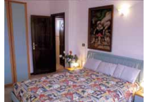
Esempio sistemazione Il Borgo