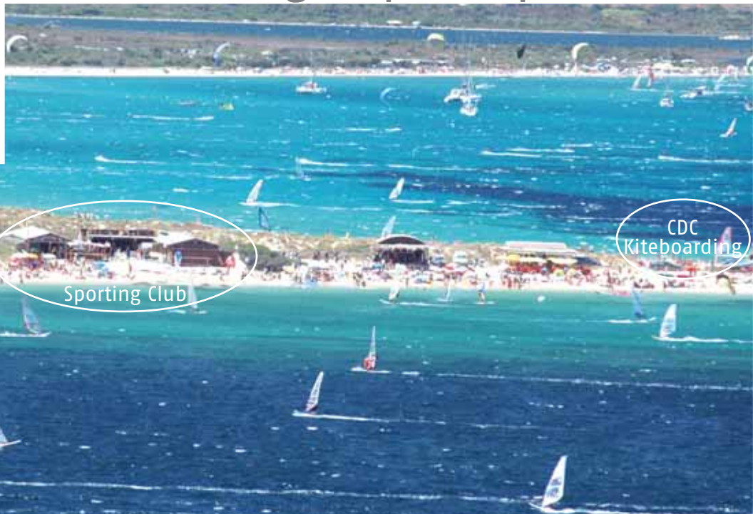
Sporting Club Sardinia (sinistra) + kitecenter