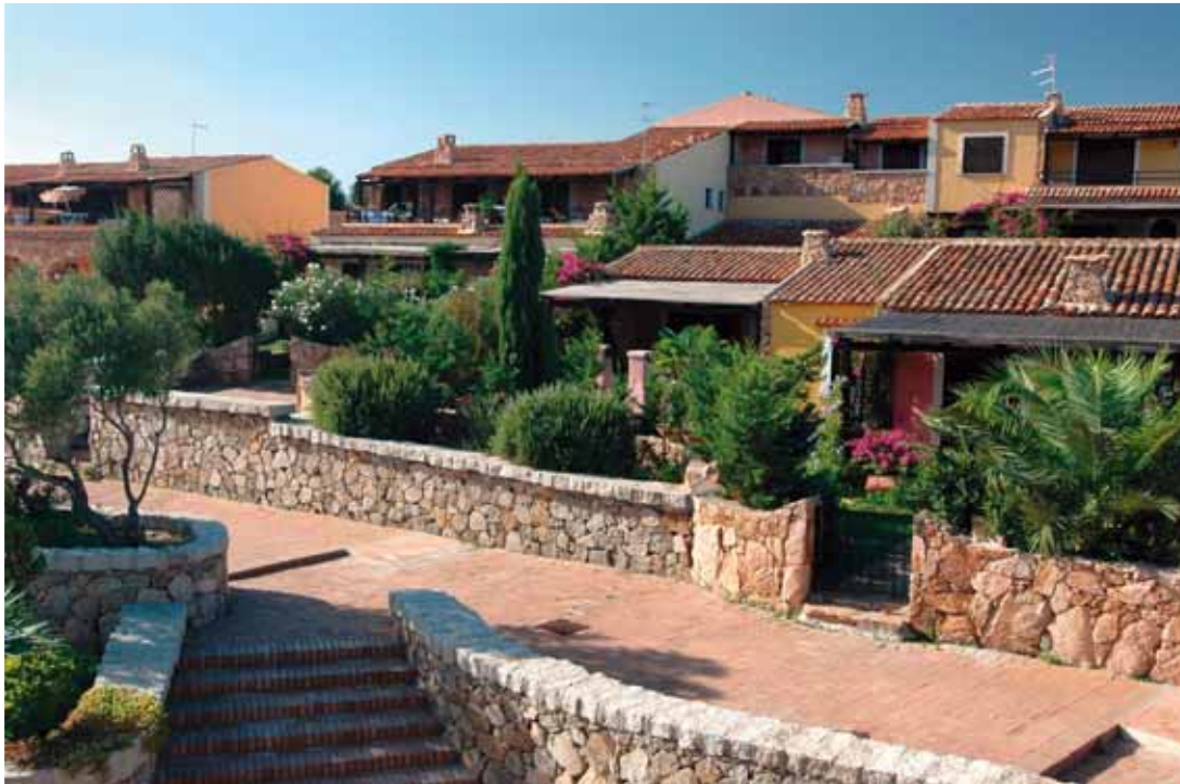
Complesso di bungalow Il Borgo