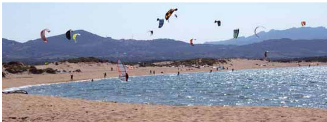
Baia Kite Porto Pollo

Il residence IL BORGO è ideale anche per le famiglie perchè all'interno del complesso non sono ammesse le macchine. La Sardegna offre molto a tutti gli sportivi. Oltre al windsurf e il kite si possono praticare tanti sport come mountainbike, vela, catamarano, immersioni o snorkelling nelle acque cristalline dell'isola. Chi cerca altri svaghi, può passare il tempo a visitare la famosa Costa Smeralda e Porto Cervo. Per chi cerca la grande vita notturna, Porto Pollo non è proprio ideale perchè le discoteche sono da raggiungere solo in macchina. Però i surfisti trovano di tutto nelle immediate vicinanze: acqua piatta nella baia destra e le onde nella baia sinistra. Anche i kiter da molto tempo hanno scoperto questo superspot. In alta stagione, nel mese di agosto, la spiaggia diventa abbastanza affollata. Per chi ha la possibilità di scegliere il periodo delle ferie consigliamo di venire in primavera o autunno quando il vento - secondo le statistiche - è anche più sicuro.