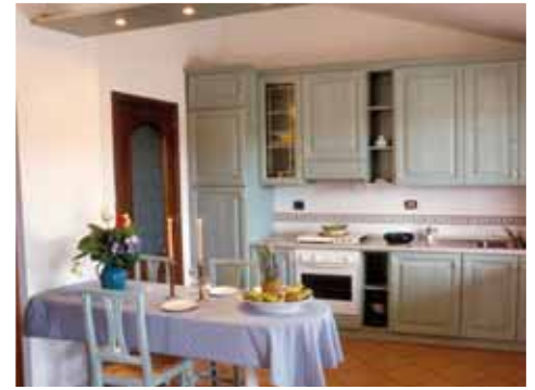
Il Borgo: esempio cucina