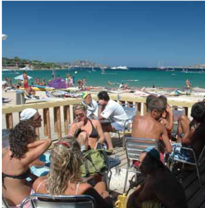
Bar nel Sporting Club