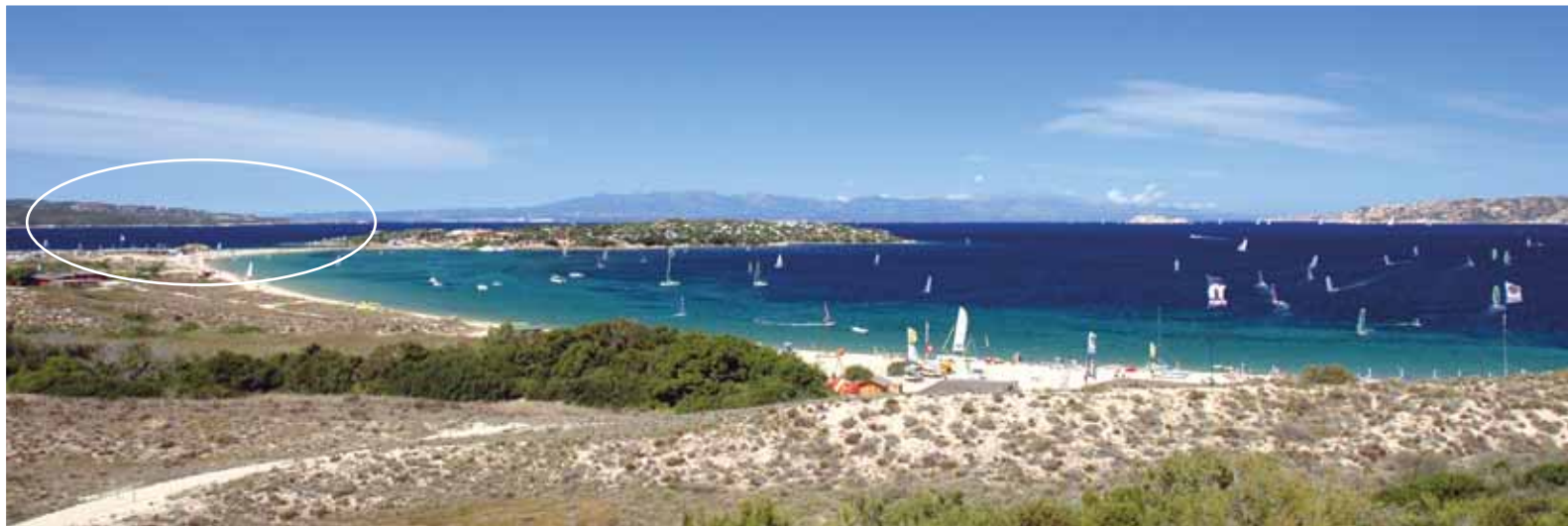
Vista sulla baia surfistica e l'Isola dei Gabbiani, lontano in fondo Corsica. All'interno del cerchio: centro windsurf e kite

Lasciate perdere le vostre idee verso "l'esotico" e rimanete "a casa", in Sardegna, a Porto Pollo ! Questo famoso surfspot con le sue 2 grandi baie e i 7 km di spiagge sabbiose si trova nel nord della Sardegna, di fronte alla Corsica. Tipici ristoranti sardi e vari bar in spiaggia aspettano i numerosi surfisti. Palau, il più vicino paese un po' più urbanizzato, si trova a 8 minuti di macchina e ha un supermercato, negozi, ristoranti e bar. La Sardegna è raggiungibile in aereo (volo su Olbia) o traghetto. Chi arriva in aereo deve fare un transfer di circa 1 ora in taxi. Secondo noi è meglio essere flessibili e consigliamo di prenotare una macchina a noleggio che viene consegnata in aeroporto. In traghetto si può arrivare con la propria macchina da Livorno, Genova o Civitavecchia. L'attraversata dura tra le 6 alle 12 ore. In alternativa c'è anche un traghetto via Corsica che arriva sulla costa nord della Sardegna, a circa 30 minuti di macchina da Porto Pollo.