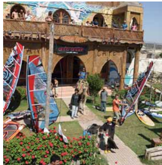
Surfclub Sidi Kaouki