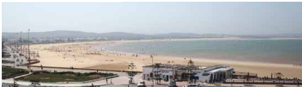
La baia di Essaouira