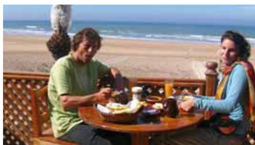
Terrazzo del Surfclub Sidi Kaouki